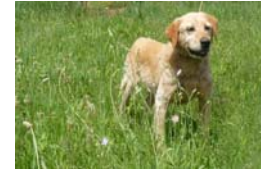
« Twister »

Ils s'appellent « Baloo », « Tim » et « Twister », sont tous âgés de plus de 12 ans et attendent encore une adoption dans la pension qui nous les garde. Malheureusement, comme tous les animaux que nous recueillons, ils ont une histoire dramatique derrière eux et, pour cela, méritent encore plus que nous leur trouvions un foyer chaleureux. Et si vous étiez ce foyer ?