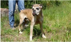
« Baloo »